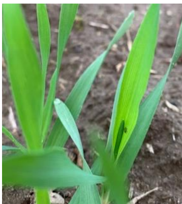
Bilder: Blattlaus in Wintergerste gegen das Sonnenlicht