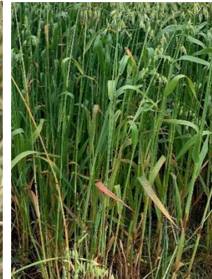
rote Blätter durch Virusbefall im Hafer