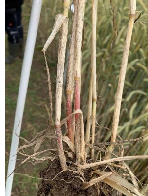
Virusbefall am Roggenstängel