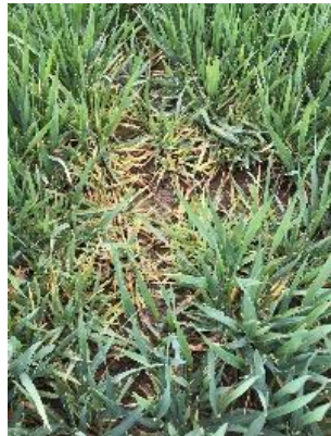
Befallsnest in Gerste (Elefantenfuß)